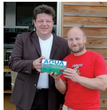
Roland Düringer, der Benzinbruder aus Hinterholz 8, ist schon seit einiger Zeit zufriedener Aquavital-Kunde.

Durch Aquavital entfallen zur Gänze, Enthärtungsmittel, Weichmacher und chemische Haushaltsreiniger. Weiters fallen keine Wartungs-, Entkalkungs- und Reparaturarbeiten mehr an, die bisher sehr kostenintensiv waren.