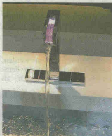
Leuchtende Armaturen

In Sachen „alternative Lösungen“ kann man sich auf der Häuslbauermesse auch in anderen Bereichen einiges erwarten.