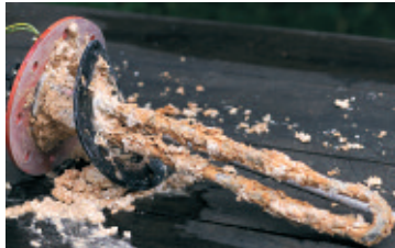
Kalk verursacht Kosten

Wasser muss rein sein. Wasser muss gesund sein. Wasser soll schmecken. Der Kalkmagnet der Fohnsdorfer Firma Aquavital sorgt heute in über 20 Ländern weltweit für vitalisiertes und entkalktes Wasser.